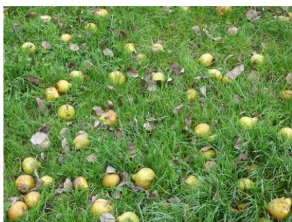
Poires à ramasser.